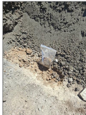
Slika 4. Lokacija uzorkovanja: KO Stari Grad pozicija 5 i 6 na mapi