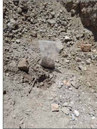
Slika 3. Lokacija uzorkovanja: KO Stari Grad pozicija 3 i 4 na mapi