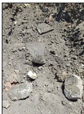
Slika 2. Lokacija uzorkovanja: KO Stari Grad pozicija 1 i 2 na mapi

Ovaj izveštaj je poverljiv dokument i ne sme se menjati ni objavljivati bez odobrenja INSTITUTA MOL d.o.o. Izveštaj se može reprodukovati i umnožavati isključivo u celini uz saglasnost INSTITUTA MOL d.o.o.